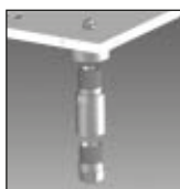
Opcjonalne nóżki KITLEGSEXT000

Taką ikoną oznaczone są wytwornice lodu Scotsman AF, które opcjonalnie produkują lód z wody demineralizowanej lub destylowanej.